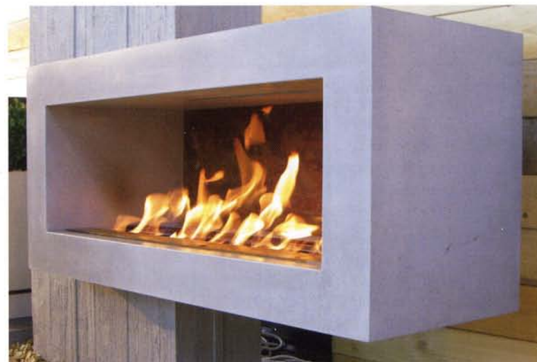
Ab Mitte 2010 erhältlich: der erste Kamin mit Bio-Ethanol-Brennkammer aus Beton

Villa Rocca OHG Auerstr. 6 79108 Freiburg info@villarocca.de www.villarocca.de